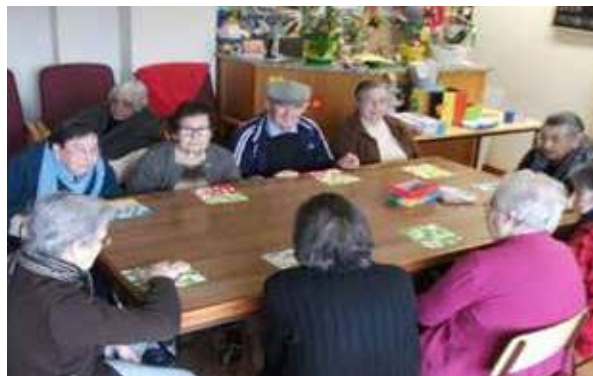
Jogos de mesa e reabilitação cognitiva

Também no Master Chef Sénior onde todos puderam dar largas à imaginação e confeccionar o seu próprio pão com ingredientes à sua escolha.