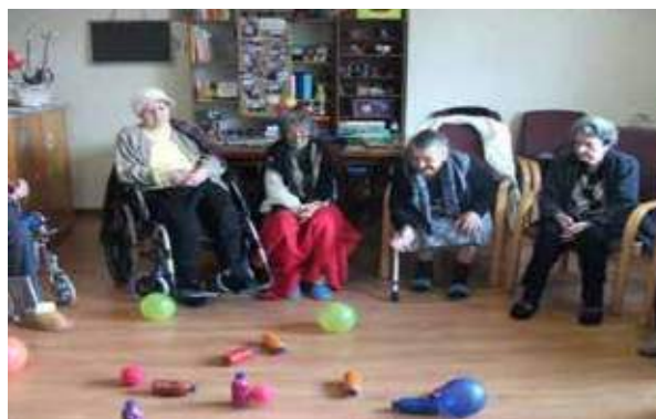
Atividades de expressão fisicomotoras

Entre as várias atividades efetuadas na instituição também destacamos o início aos trabalhos alusivos ao Dia da Mãe, princípio de tudo e sinónimo de AMOR.